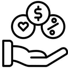
VAMED Vitality World Mitarbeiterrente