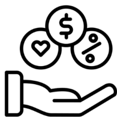
VAMED Vitality World Mitarbeiter rate